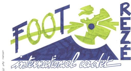
L'entente Rezéenne présente le nouveau logo qui sera utilisé à partir de 1990