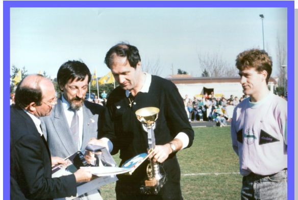
Reconnaissez-vous les deux personnages de droite ? Il y a Michel VAUTROT qui arbitre la finale et Didier DESCHAMPS qui est le joueur du FCN parrain du tournoi 1989

Le weekend c'est la ronde des recruteurs autour des terrains mais c'est aussi l'occasion de rencontrer de nombreux joueurs professionnels, pour les anciens le nom de Frankie VERCAUTEREN rappellera peut-être des souvenirs