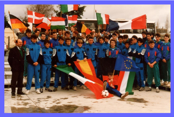
Le vendredi soir, c'est l'accueil des équipes, c'est aussi la répartition des joueurs et des dirigeants dans les familles d'accueil

Nouveauté cette année les joueurs rezéens n'évoluent plus dans les équipes de leur club, ils composent deux équipes, l'une appelée Entente Rezé, l'autre Sélection de Rezé. Nous avons toujours un plateau de 24 équipes dont 7 équipes étrangères avec des nouveautés comme l'équipe d'ARHUS (Danemark), ESTERGOM (Hongrie), et au niveau des équipes françaises la participation de l'Olympique de MARSEILLE et du MONTPELLIER Hérault Sport Club.