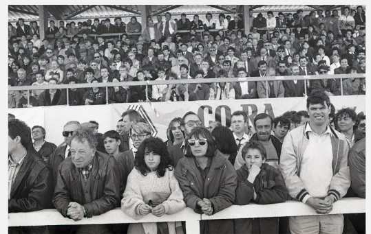
Toujours plus, la presse annonce 12 000 spectateurs